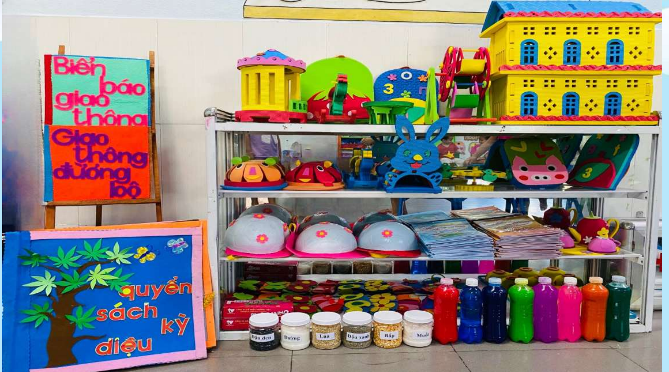
Hình ảnh: Góc học tập