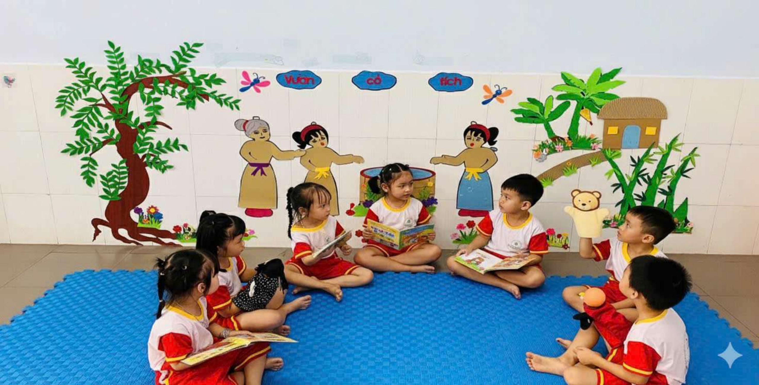
Hình ảnh: Trẻ đọc thơ, múa rối ở góc học tập