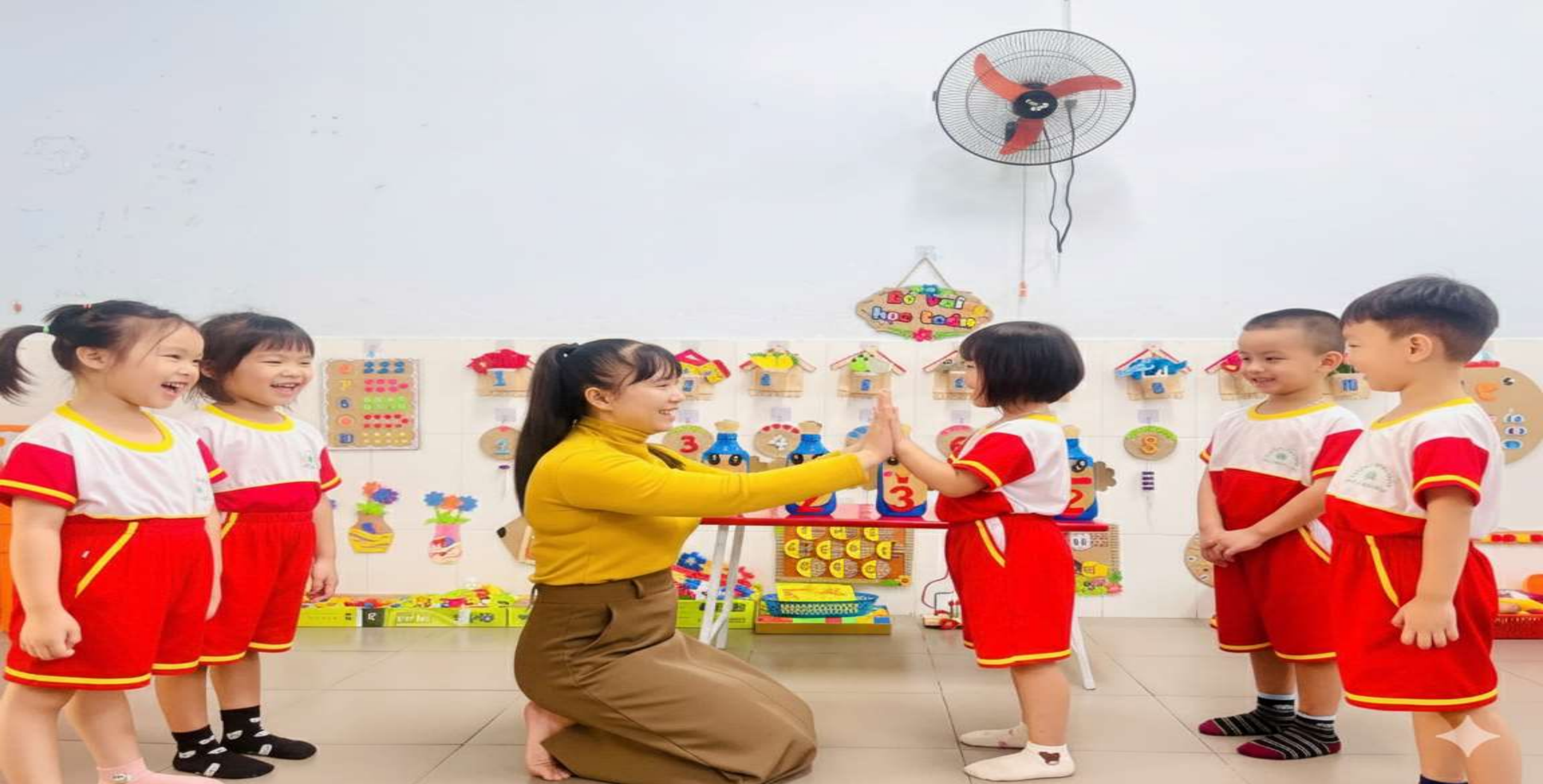
Hình ảnh: Cô và trẻ đập tay nhau khi trẻ chiến thắng