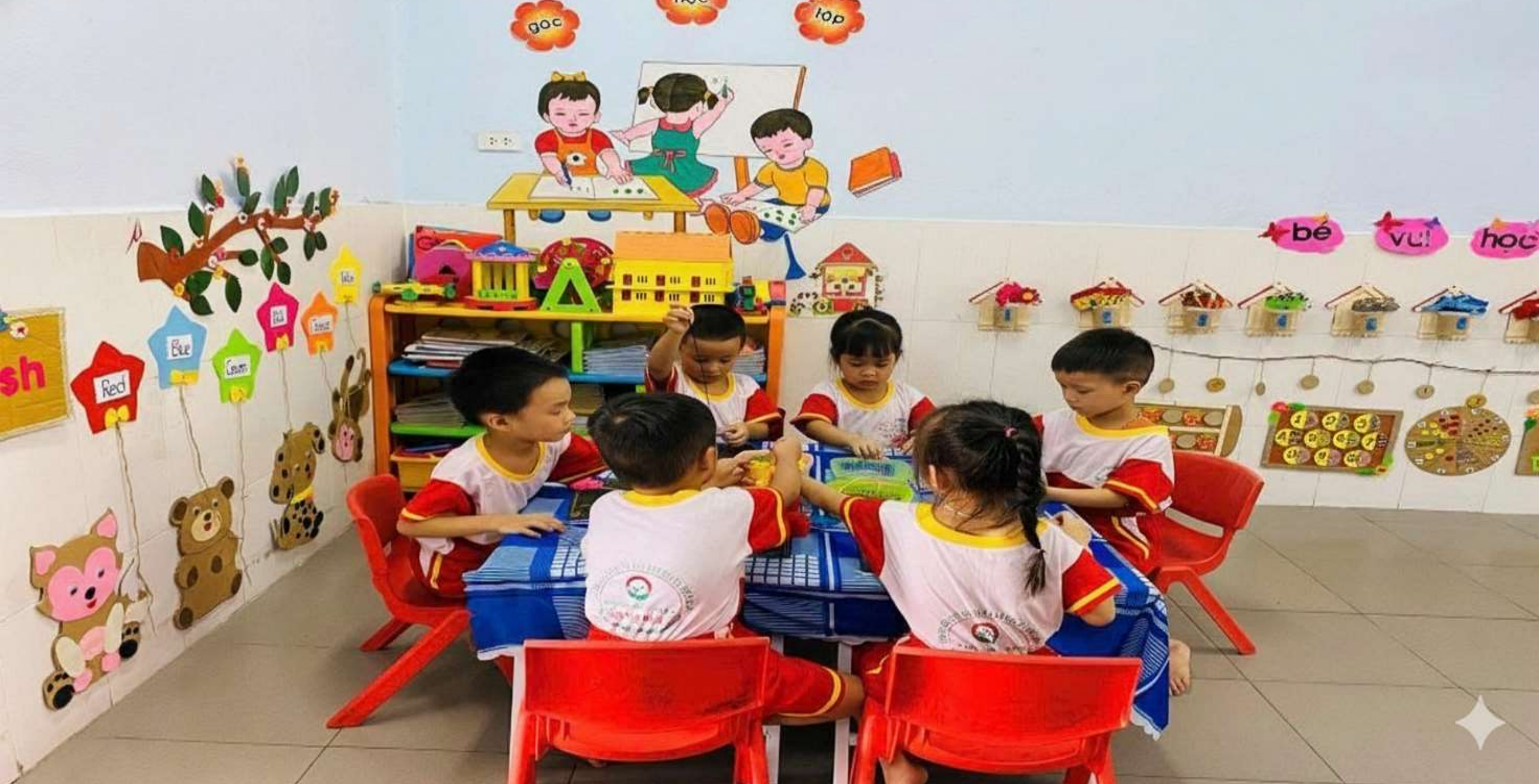
Hình ảnh: Trẻ chơi trò chơi: “Nhanh tay lẹ mắt”