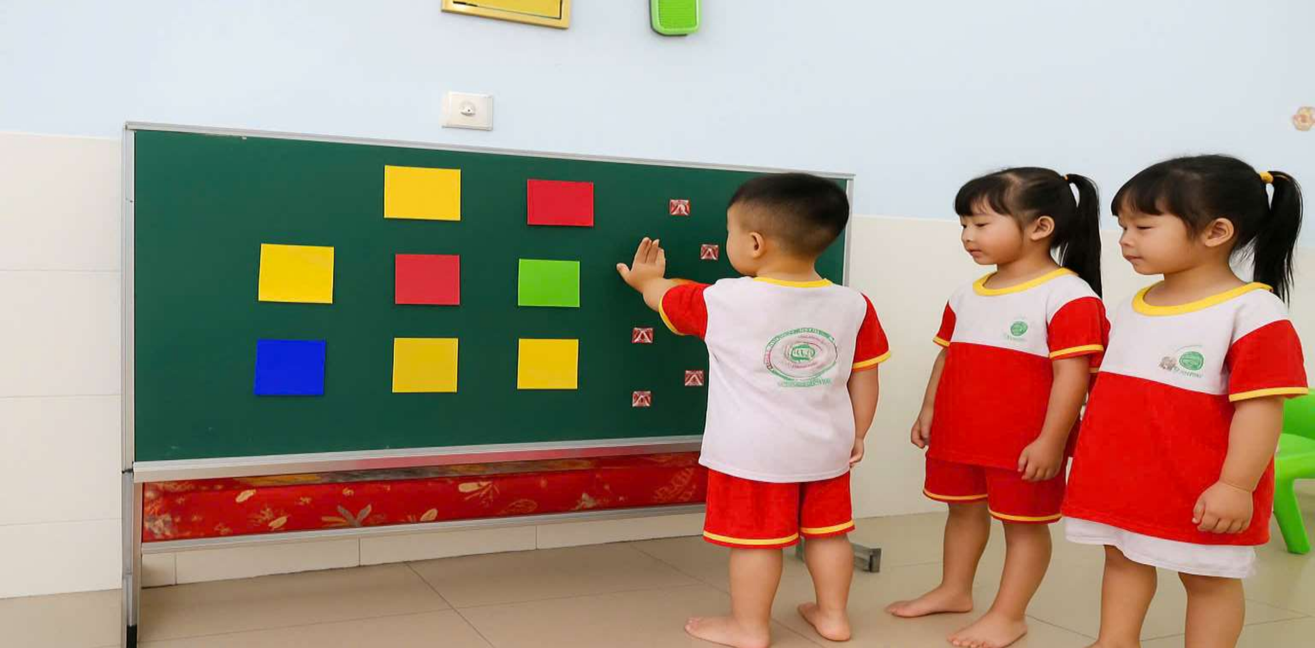
Hình ảnh: Trẻ chơi trò chơi: “Bốc thăm trúng thưởng”