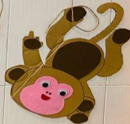
Hình ảnh: Góc làm quen Tiếng Anh