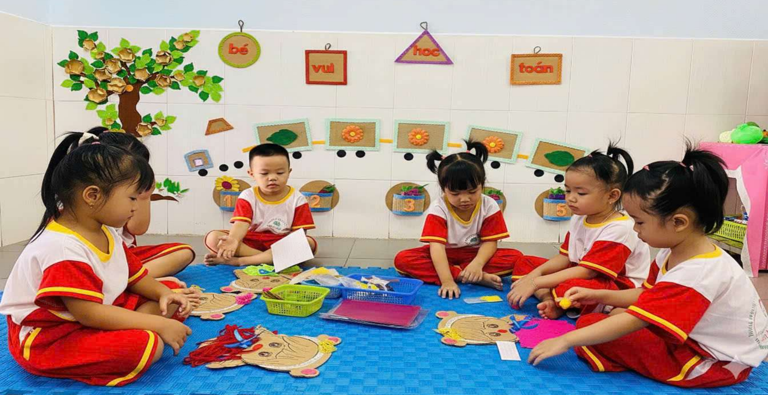
Hình ảnh: Trẻ đang dùng nguyên vật liệu để tạo ra sản phẩm