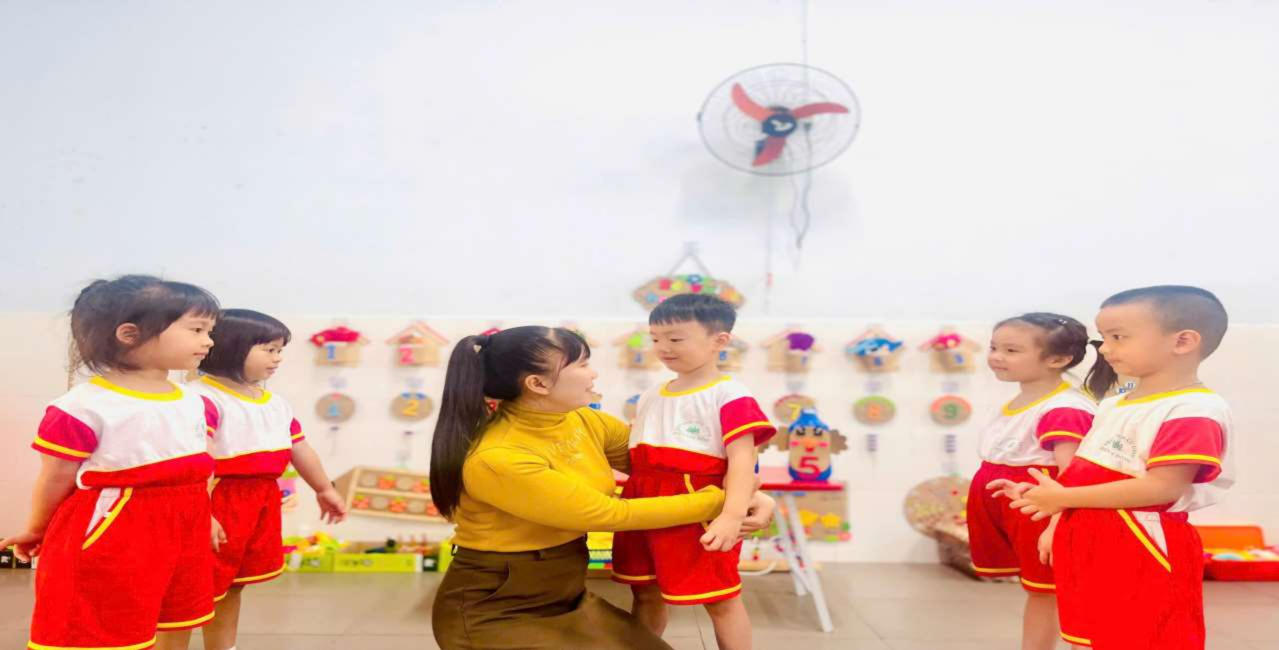
Hình ảnh: Cô an ủi, động viên khi trẻ chơi chưa tốt